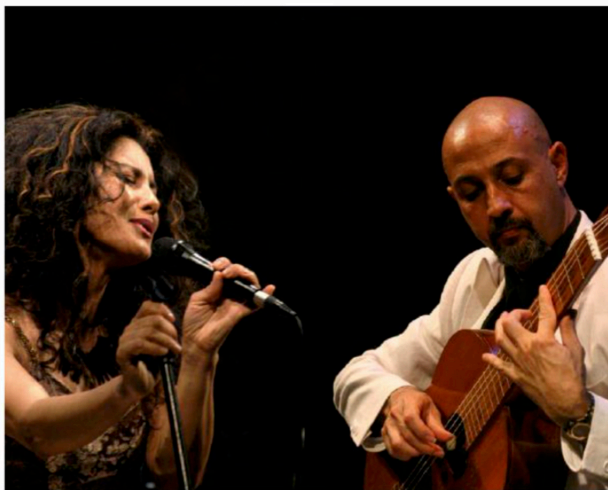
Voce e chitarra

Attraverso l'elettronica possiamo innanzitutto mettere in atto una spazializzazione dei suoni e una valorizzazione dei timbri. Nei brani più "tradizionali" ci consente di falsare le strutture simmetriche. L'elettronica rappresenta dunque per noi una sorta di ponte che ci avvicina al mondo della musica sperimentale.