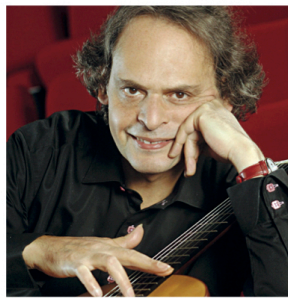
Roland Dyens, uno degli ospiti internazionali della kermesse

il Conservatorio di Darfo. «Voglio che gli appassionati di chitarra non siano solo spettatori - puntualizza Lavia - devono sentirsi parte di un progetto e devono poter valorizzare la propria espressività. Gli artisti affermati sono qui anche per loro, per fornire ispirazioni e modelli. Inoltre, chi fa musica non per mestiere, ma a livello se-